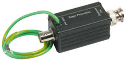
Рис.1 Внешний вид SP009