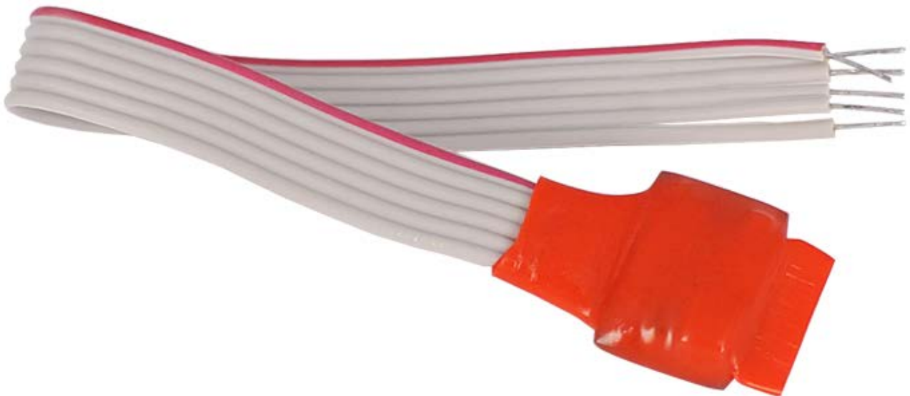
Рисунок 2.2.1 Внешний вид АР1

На рисунке 2.2.1 представлены внешний вид АР1.