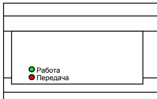
Рис. 1. Внешний вид передатчика (надписи показаны условно)

Замечание. На передней панели корпуса есть кнопка, которая не используется.